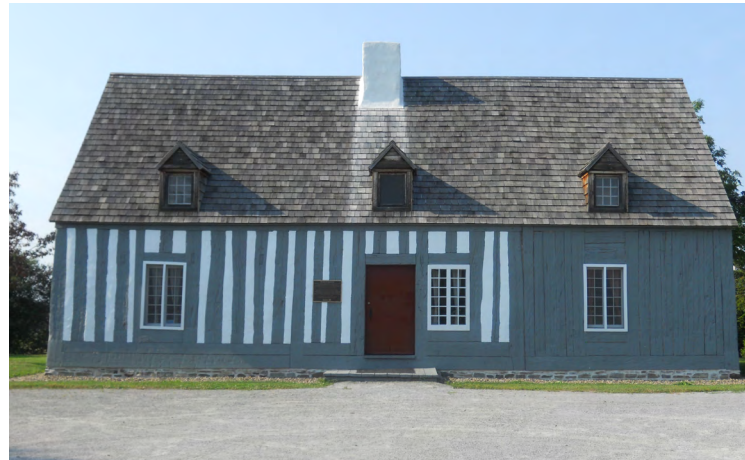
Maison Lamontagne, 707, boulevard du Rivage (Rimouski-Est) Société rimouskoise du patrimoine

Quelques bâtiments présents sur le territoire de la Ville détiennent des caractéristiques pouvant être associées au style esprit français. Il s'agit habituellement des plus vieilles constructions du territoire. Cependant, quelques bâtiments construits à une époque plus rapprochée reprennent l'essence du style esprit français, comme la maison sise au 302, montée des Saules dans le quartier Sacré-Cœur. Son revêtement mural en crépis et enduit , ses ouvertures disposées de façon asymétrique , ses lucarnes , ainsi que sa toiture à deux versants à pente abrupte font un écho remarquable au style.