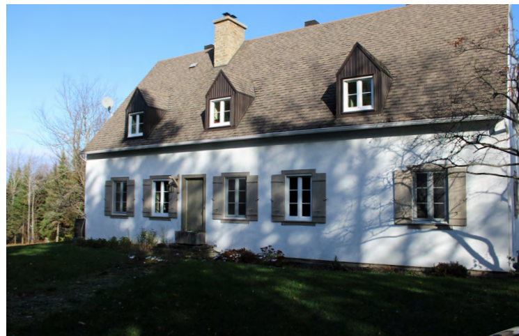
302, montée des Saules (Sacré-Cœur), 2023 Tommy Lefebvre, Société rimouskoise du patrimoine