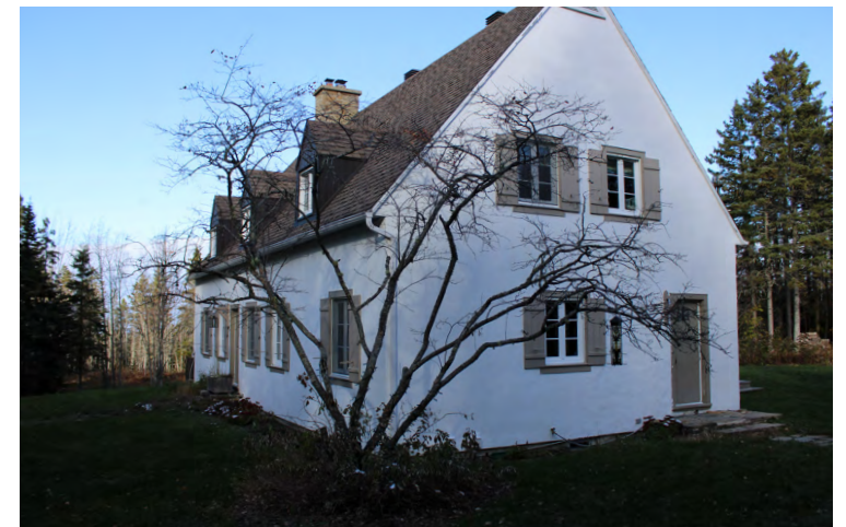
302, montée des Saules (Sacré-Cœur), 2023 Tommy Lefebvre, Société rimouskoise du patrimoine