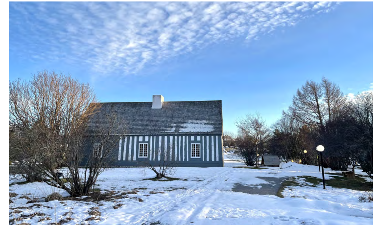
Maison Lamontagne en hiver, 707, boulevard du Rivage (Rimouski-Est), 2022 Olivier Beaudin