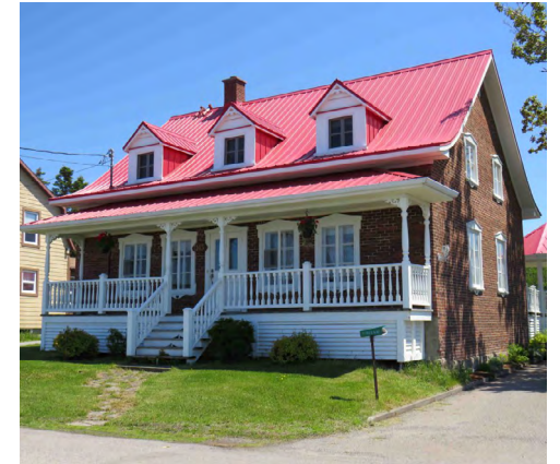
1143, rue du Phare (Pointe-au-Père) Société rimouskoise du patrimoine