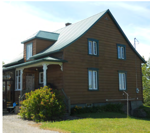
589, chemin du Panorama (Saint-Pie-X) Société rimouskoise du patrimoine