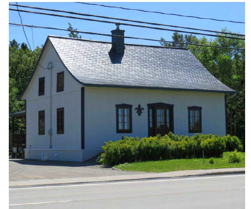
863, boulevard Sainte-Anne (Pointe-au-Père) Société rimouskoise du patrimoine