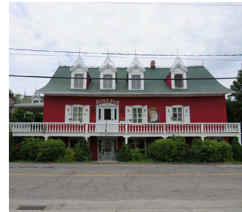
148, rue de Sainte-Cécile-du-Bic (Le Bic) Société rimouskoise du patrimoine