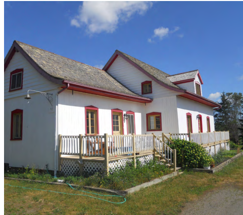
786, rue Lausanne (Sacré-Cœur) Société rimouskoise du patrimoine

On retrouve quelques maisons québécoises complètement en Pierre ou en brique , ce qui, dans une certaine mesure, démontre les moyens financiers aisés de son propriétaire initial. Aux 18e et 19e siècles, l'accès aux marchés anglais et américains, ainsi que l'amélioration des conditions de vie et financières permettent aux propriétaires d'appliquer certaines peintures ou teintures de couleur. Bien que toujours modestes, les maisons québécoises auront parfois une ornementation mise en valeur par un découpage coloré contrastant, notamment en ocre, en bleu (bleu de Prusse ou outremer), en vert ou toutes autres combinaisons possibles, selon les pigments ou produits disponibles à cette époque.