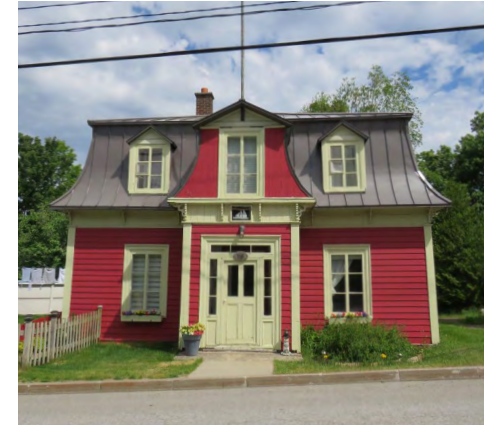
116, rue de Sainte-Cécile-du-Bic (Le Bic) Société rimouskoise du patrimoine