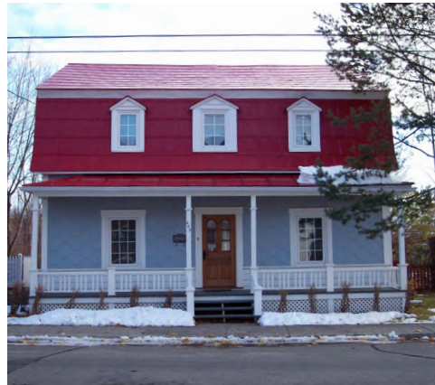
225, rue de l'Évêché Ouest (Saint-Germain) Société rimouskoise du patrimoine

Bien qu'il ne faille pas généraliser, les maisons à toiture mansardée à quatre versants semblent avoir été construites ainsi, dans une intention de représenter le style Second Empire. Alors que les maisons à toiture mansardée à deux versants sont pour la plupart, des maisons québécoises auxquelles les toitures ont été modifiées au fil du temps pour bénéficier d'un plus grand espace.