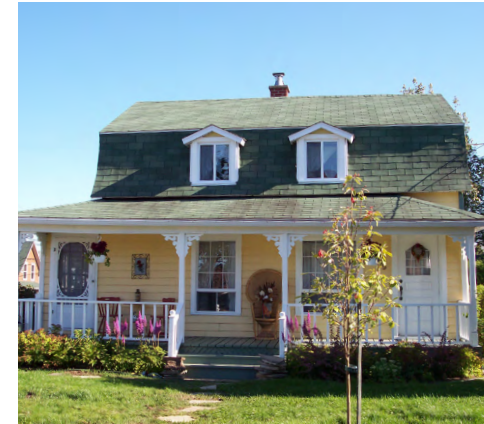
465, rue La Salle (Nazareth) Société rimouskoise du patrimoine