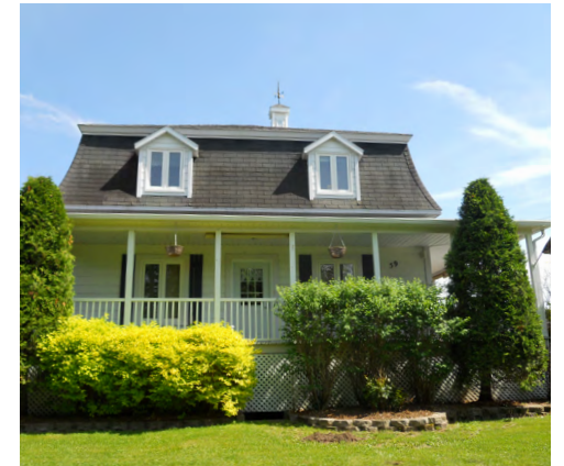
59, chemin du Petit-Lac-Macpès (Mont-Label) Société rimouskoise du patrimoine