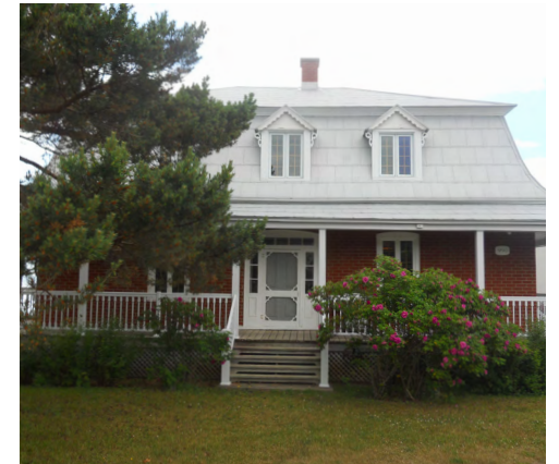
990, boulevard Saint-Germain (Sacré-Cœur) Société rimouskoise du patrimoine