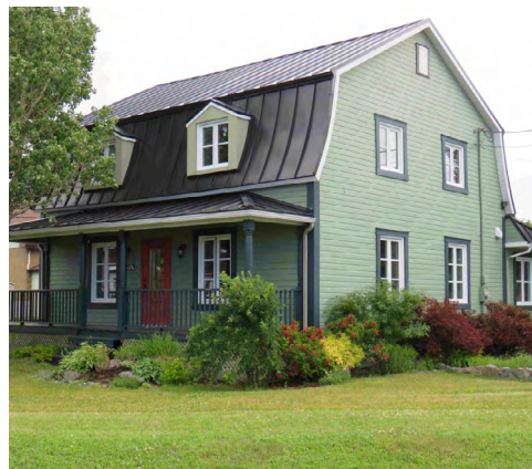
185, rue du Fleuve (Pointe-au-Père) Société rimouskoise du patrimoine