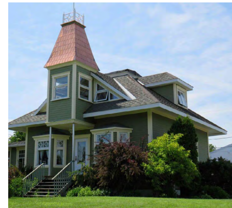
332, avenue du Père-Nouvel (Pointe-au-Père) Société rimouskoise du patrimoine