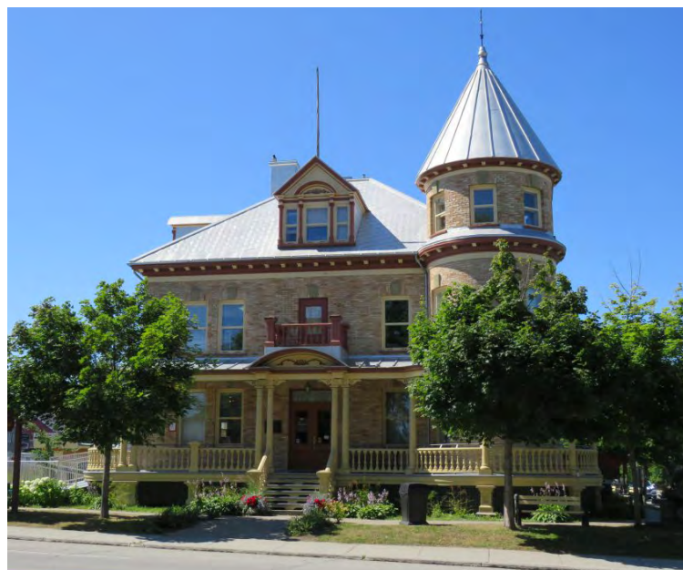
Maison Joseph-Gauvreau 1, rue de l'Évêché Ouest (Saint-Germain) Société rimouskoise du patrimoine

La maison Dubé est toutefois une exception intéressante. Construite en 1945, elle représente une mixité de styles qui fait référence au contexte social de l'époque. Le milieu du 20e siècle est marqué par la forte croissance du modernisme. Les revêtements de Pierre taillée en granite sont des caractéristiques du style moderne, tout comme les insertions de brique de verre et les éléments de béton moulé . La maison Dubé reprend cette matérialité, tout en l'agençant avec le style néo-Queen Anne qui définit sa volumétrie comprenant une tour .