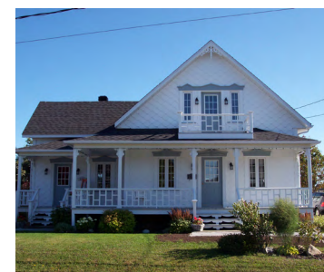
499, rue LaSalle (Nazareth) Société rimouskoise du patrimoine