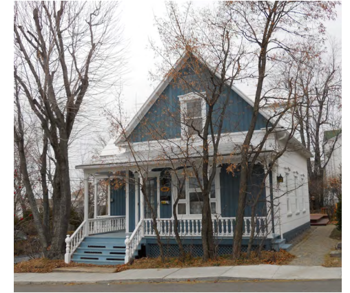
264, avenue Belzile (Saint-Germain) Société rimouskoise du patrimoine