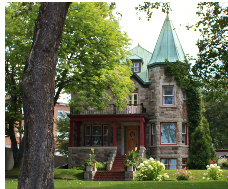
Maison Dubé, 233, rue Saint-Germain Ouest, 2023 (Saint-Germain) Sandrine Gauthier, Ville de Rimouski