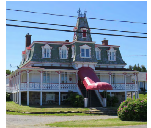
1329, boulevard Sainte-Anne (Pointe-au-Père) Société rimouskoise du patrimoine