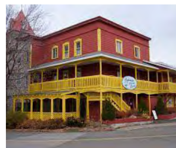
134, rue J.-Romuald-Bérubé (Le Bic) Société rimouskoise du patrimoine