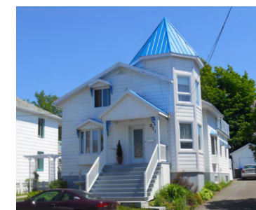
211, rue Ouellet (Saint-Robert) Société rimouskoise du patrimoine