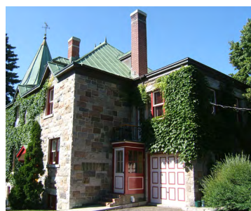
233, rue Saint-Germain Ouest (Saint-Germain) Société rimouskoise du patrimoine