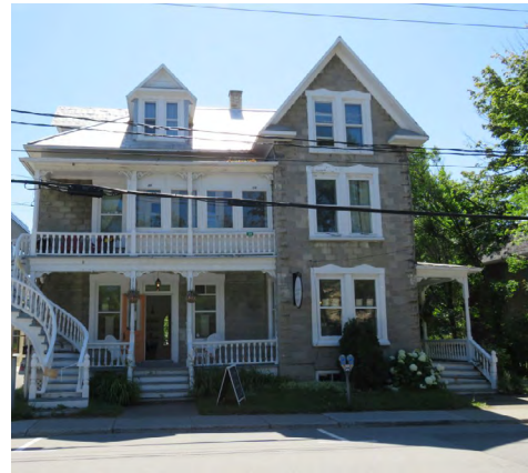
25, rue de l'Évêché Ouest (Saint-Germain) Société rimouskoise du patrimoine

Dans cette mouvance pour attirer les regards, les bâtiments comporteront énormément de caractéristiques architecturales empruntées aux styles antérieurs comme le style gothique et sa verticalité, le style classique et ses ordres, le style géorgien et sa symétrie, le style renaissance et ses proportions, ainsi que le style Second Empire et son exubérance. Quelques exemples rimouskois illustrent cet éclectisme victorien.