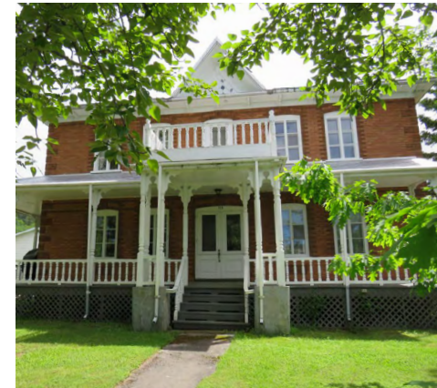
115, rue de Sainte-Cécile-du-Bic (Le Bic) Société rimouskoise du patrimoine