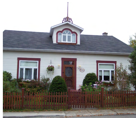
411, rue Saint-Émile (Nazareth) Société rimouskoise du patrimoine