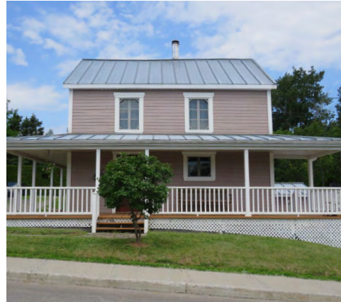
170, rue Saint-Elzéar (Le Bic) Société rimouskoise du patrimoine

Au Bic, beaucoup de maisons vernaculaires américaines présentent une toiture à demi-croupes , c'est-à-dire une toiture à pignon tronqué souvent associé à la villégiature et au style Arts & Crafts .