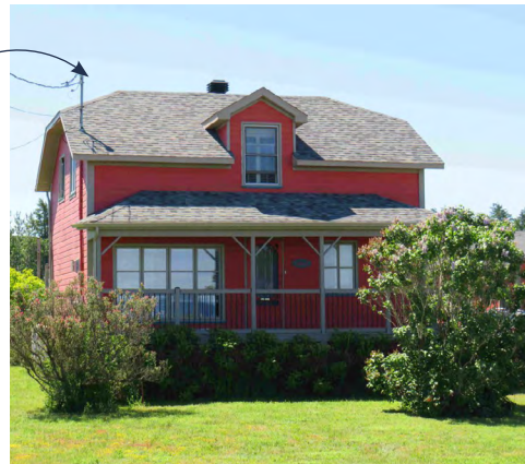
1663, boulevard Sainte-Anne (Pointe-au-Père) Société rimouskoise du patrimoine