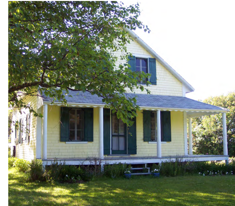
15, route Santerre (Le Bic) Société rimouskoise du patrimoine