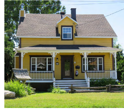
684, route des Pionniers (Sainte-Blandine) Société rimouskoise du patrimoine