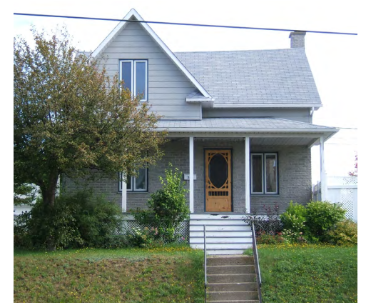
332, avenue Rouleau (Saint-Robert) Société rimouskoise du patrimoine