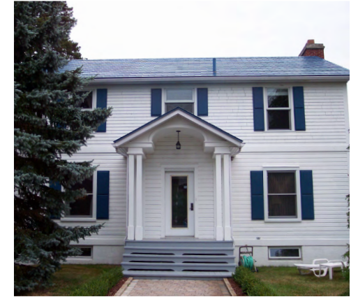
383, rue La Salle (Nazareth) Société rimouskoise du patrimoine