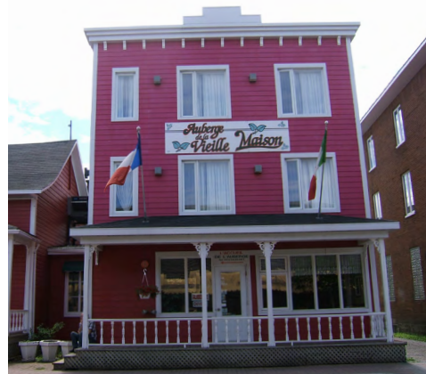
27-35, rue Saint-Germain Est (Saint-Germain) Société rimouskoise du patrimoine