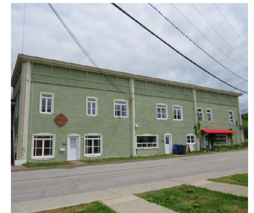
138, rue de Sainte-Cécile-du-Bic (Le Bic) Société rimouskoise du patrimoine