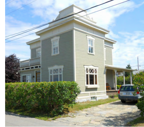
355, rue Saint-Germain Est (Sainte-Agnès) Société rimouskoise du patrimoine