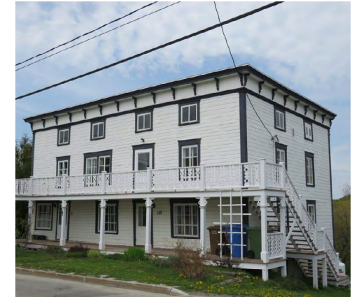
146, rue de Sainte-Cécile-du-Bic (Le Bic) Société rimouskoise du patrimoine