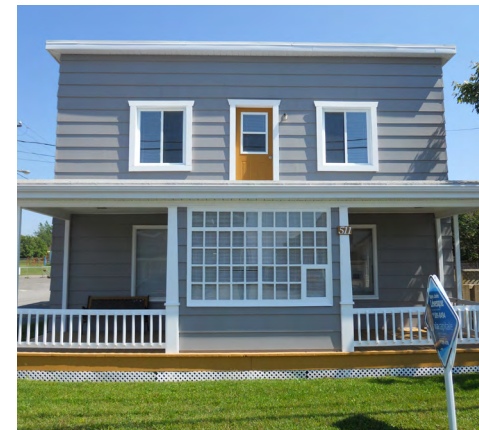
511, rue Saint-Germain (Rimouski-Est) Société rimouskoise du patrimoine