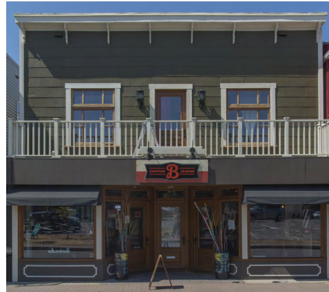
22-26, rue Saint-Germain Est (Saint-Germain) Société rimouskoise du patrimoine

Les bâtiments Boomtown se situent généralement en contexte urbain, sur les rues les plus achalandées. Il s'agit, la plupart du temps, des plus vieux commerces de chaque localité présentant des vitrines au rez-de-chaussée . À Rimouski, ils sont les vestiges de la prospérité économique des 19e et 20e siècles. Les étages supérieurs servaient d'entrepôt ou de logement pour les propriétaires ou les employés.