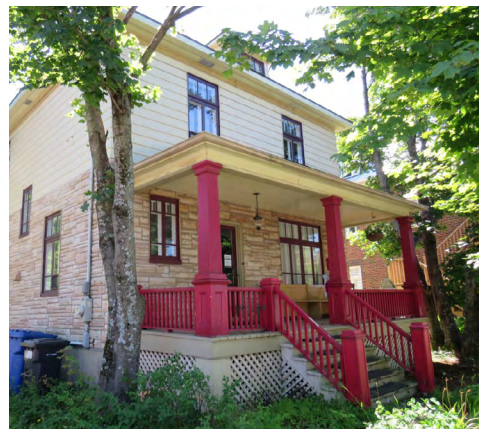
71, rue de l'Évêché Ouest (Saint-Germain) Société rimouskoise du patrimoine