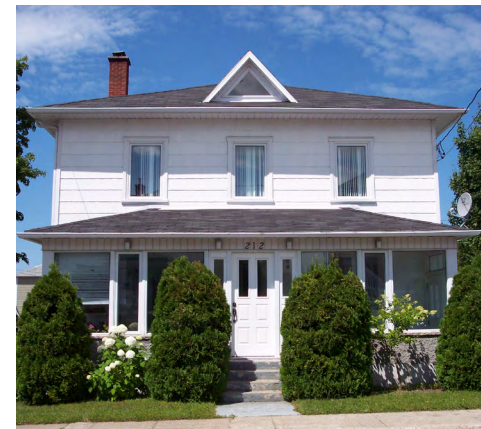
212, rue Notre-Dame Ouest (Saint-Robert) Société rimouskoise du patrimoine