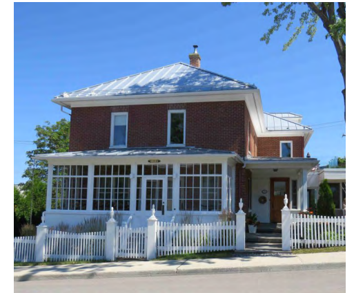
286, rue Saint-Hubert (Saint-Germain) Société rimouskoise du patrimoine