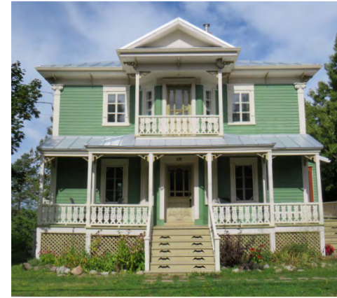
336, rue de Sainte-Cécile-du-Bic (Le Bic) Société rimouskoise du patrimoine