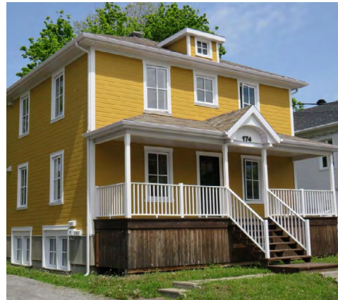
174, rue Sainte-Anne (Saint-Germain) Société rimouskoise du patrimoine

Le secteur du Faubourg rouge, formé des rues Saint-Hubert, Sainte-Ursule et Notre-Dame Est, présente une homogénéité de maisons cubiques. Celles-ci sont majoritairement en brique rouge donnant le nom au secteur. Ces bâtiments sont issus d'un programme d'aide à la construction de logements ouvriers en vigueur au début du 20e siècle [Société rimouskoise du patrimoine, 2018].