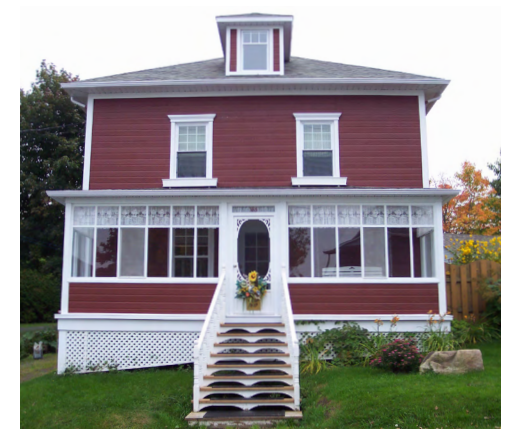
385, rue La Salle (Nazareth) Société rimouskoise du patrimoine