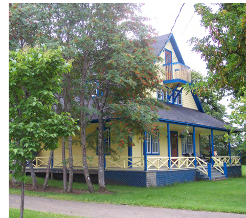
2261, route 132 Est (Le Bic) Société rimouskoise du patrimoine