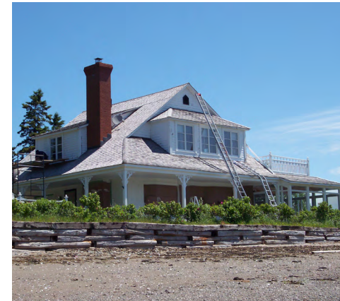
205, route du Golf-du-Bic (Le Bic) Société rimouskoise du patrimoine