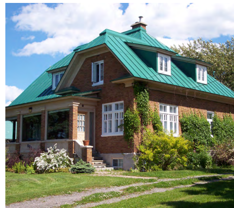
521, rue du Fleuve (Pointe-au-Père) Société rimouskoise du patrimoine