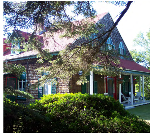
9, chemin des Coquillages (Le Bic) Société rimouskoise du patrimoine

En général, les bâtiments de style Arts & Crafts sont recouverts de bardeau de bois . Parfois, leur toiture est composée d'un revêtement de tôle à baguette ou de tôle pincée .