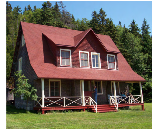
222, route du Golf-du-Bic (Le Bic) Société rimouskoise du patrimoine