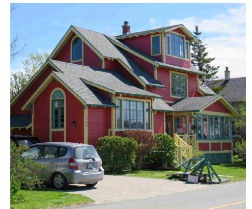
187-189, rue du Phare (Pointe-au-Père) Société rimouskoise du patrimoine