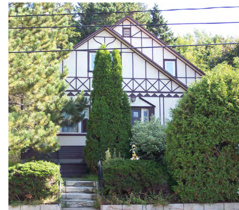
281, rue Saint-Pierre (Saint-Germain) Société rimouskoise du patrimoine *rénové