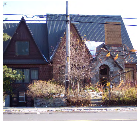
113, rue de l'Évêché Ouest (Saint-Germain) Société rimouskoise du patrimoine

Les éléments imitant les éléments de structures en bois ou en maçonnerie de Pierre sont disposés et colorés de façon à créer un contraste. Cette particularité est souvent nommée comme un style à part entière du mouvement, le Stick Style .