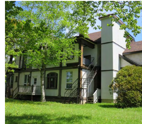
Maison Jules-A.-Brillant, 150, rue de l'Évêché Est (Saint-Germain) Société rimouskoise du patrimoine