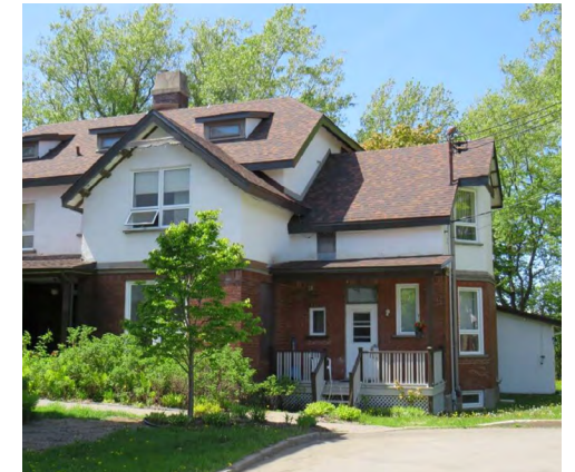
Maison Jules-A.-Brillant, 150, rue de l'Évêché Est (Saint-Germain) Société rimouskoise du patrimoine