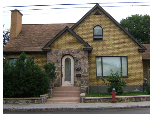
278-280, avenue Rouleau (Saint-Robert) Société rimouskoise du patrimoine