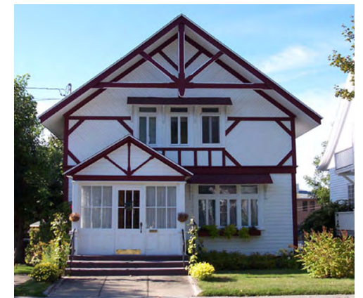
146, rue Saint-Pierre (Saint-Germain) Société rimouskoise du patrimoine