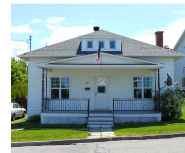
431, rue Tessier (Sainte-Odile) Société rimouskoise du patrimoine