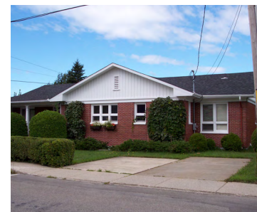
192, rue Notre-Dame Est (Saint-Germain) Société rimouskoise du patrimoine