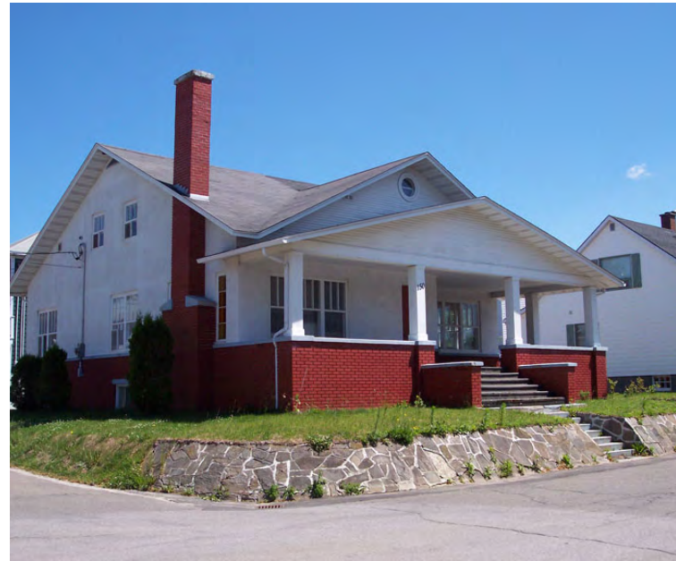
150, rue Drapeau (Saint-Germain) Société rimouskoise du patrimoine

D'autres bâtiments répartis sur le territoire ont des galeries en façade avant détenant de larges et lourdes colonnes qui soutiennent un fronton , et parfois, des murets servant de balustrades . Ces caractéristiques peuvent être attribuées au style Craftsman , bien qu'ils peuvent aussi représenter d'autres styles.