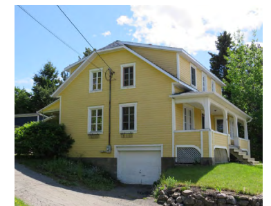
93, rue de Sainte-Cécile-du-Bic (Le Bic) Société rimouskoise du patrimoine