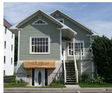
203-205, rue Saint-Germain Est (Saint-Germain) Société rimouskoise du patrimoine