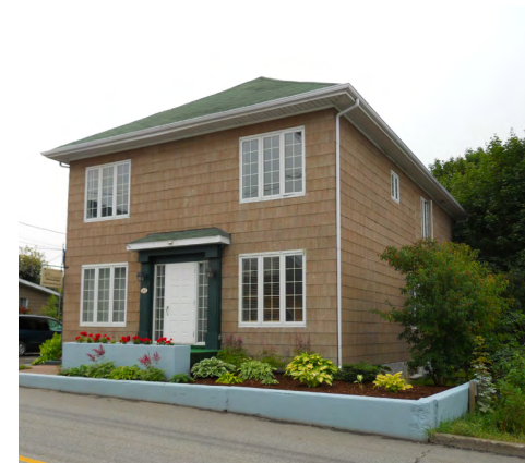
263, avenue Rouleau (Saint-Robert) Société rimouskoise du patrimoine