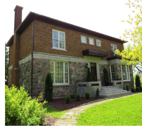
102, boulevard de la Rivière (Saint-Germain) Société rimouskoise du patrimoine