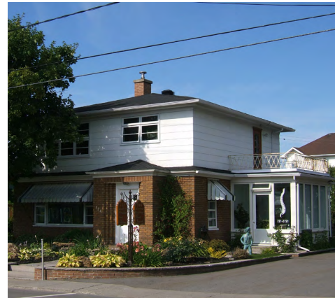
124, avenue Rouleau (Saint-Germain) Société rimouskoise du patrimoine

Les façades sont souvent asymétriques, notamment par des entrées marquées par des pilastres , des auvents ou des marquises de couleur contrastante au reste du revêtement .