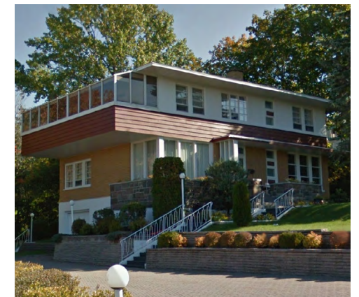
222, rue Blais (Saint-Germain), 2021