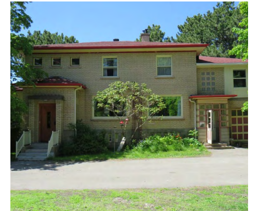
182, rue de l'Évêché Est (Saint-Germain) Société rimouskoise du patrimoine