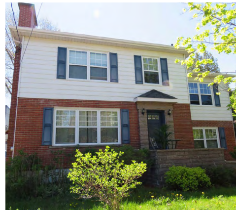
223, rue Sainte-Marie (Saint-Germain) Société rimouskoise du patrimoine