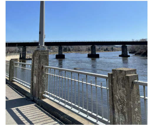
Aménagements urbains, 2023 Olivier Beaudin, Ville de Rimouski