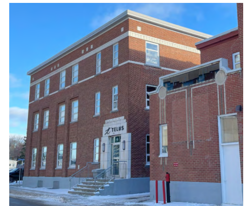
Portail, frise et mosaïque, 1-9, rue Jules-A.-Brillant, 2023 Olivier Beaudin, Ville de Rimouski