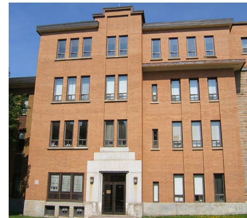
Ancienne école d'arts et de métiers (Cégep de Rimouski) Société rimouskoise du patrimoine