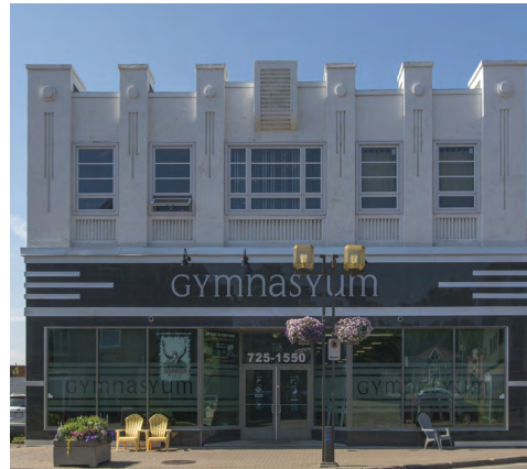
118-120, rue Saint-Germain Est (Saint-Germain) Société rimouskoise du patrimoine

Les différentes écoles qui constituent le volume complet du Cégep de Rimouski, dont l'ancienne École d'arts et de métiers de 1941 (pavillon A), ainsi que l'ancienne École de commerce de 1946-1947 (pavillon B), comportent des formes géométriques typiques du style Art déco. Les portails sont en contraste avec le revêtement de brique extérieur, et ceux-ci se disposent de façon à s'amincir en hauteur. L'aménagement urbain, notamment les balustrades le long de la rivière Rimouski, ainsi que le pont routier, comporte des piliers de béton moulé ayant des formes rappelant l'Art déco.