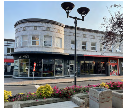
59-61, rue Saint-Germain Est (Saint-Germain), 2023 Olivier Beaudin, Ville de Rimouski