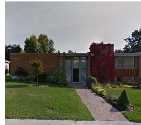
315, rue Taché (Sainte-Agnès), 2021 Google Maps