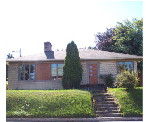
105, rue Notre-Dame Est (Saint-Germain) Société rimouskoise du patrimoine