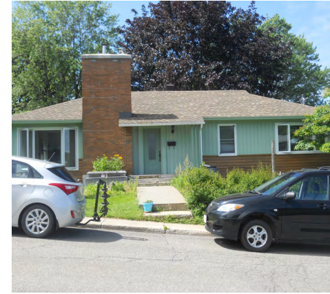
267, allée du Rosaire (Saint-Germain) Société rimouskoise du patrimoine