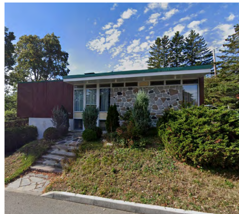
57, rue Laval Sud (Nazareth), 2021 Google Maps