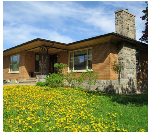
255, rue Sainte-Marie (Saint-Germain) Société rimouskoise du patrimoine

L'architecture de ces bâtiments sera traitée de façon distinguée sur l'ensemble des façades . Ils seront entre autres bien intégrés aux aménagements paysagers , notamment à l'aide de murets et d' escaliers , ainsi qu'une végétation omniprésente.