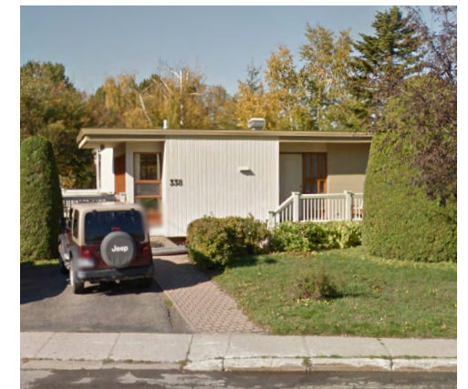
338, rue Saint-Pierre (Sainte-Agnès), 2019