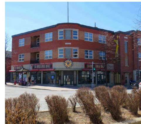
91-95, rue Saint-Germain Ouest (Saint-Germain) Société rimouskoise du patrimoine