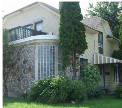
325, rue Tessier (Saint-Robert) Société rimouskoise du patrimoine