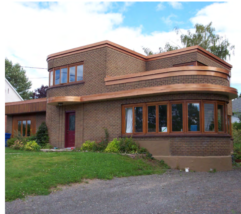
205, rue Saint-Jean-Baptiste Est (Saint-Germain) Société rimouskoise du patrimoine

D'autres bâtiments de Rimouski comportent toutefois quelques éléments du style, comme des façades arrondies et dépouillées d' ornementation .