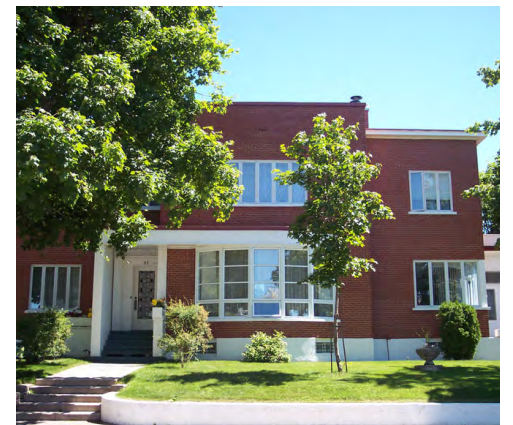
57, rue Jules-A.-Brillant (Saint-Germain) Société rimouskoise du patrimoine