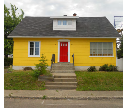
37, 10e Rue Ouest (Saint-Pie-X) Société rimouskoise du patrimoine