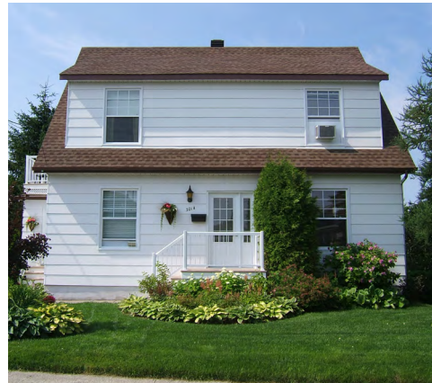
301, rue Georges-Sylvain (Saint-Robert) Société rimouskoise du patrimoine

Les quartiers centraux de Rimouski détiennent presque tous des bâtiments de style Wartime . Comme il s'agit souvent de reproductions issues de plans, il existe peu de particularités attribuables au contexte rimouskois. Notons cependant leur dispersement à travers la ville, en opposition aux développements de quartiers dans les grands centres urbains où plusieurs bâtiments Wartime se succèdent sur une même rue.