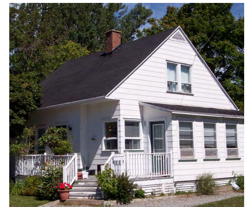
180, rue Fiset (Sainte-Agnès) Société rimouskoise du patrimoine