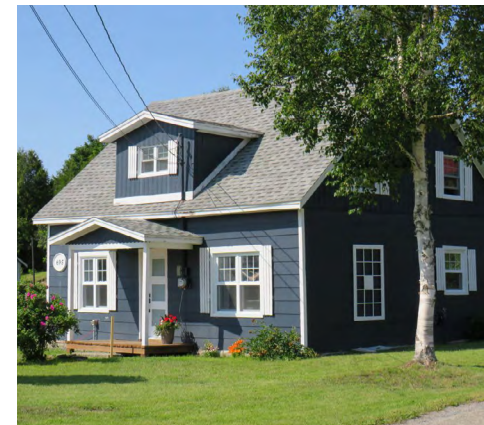
695, route des Pionniers (Sainte-Blandine) Société rimouskoise du patrimoine