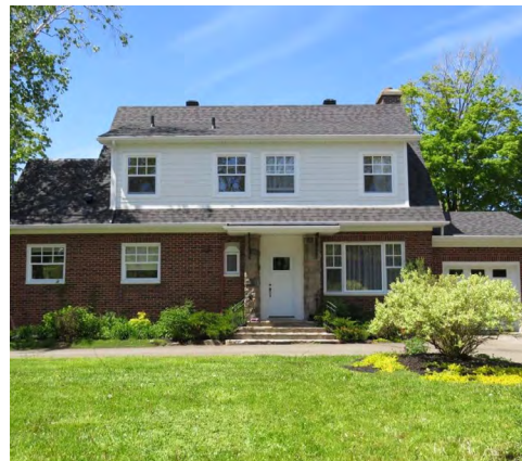
242, rue de l'Évêché Est (Saint-Germain) Société rimouskoise du patrimoine