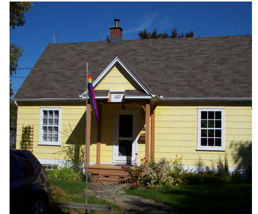
51-55, rue de l'Évêché Ouest (Saint-Germain) Société rimouskoise du patrimoine