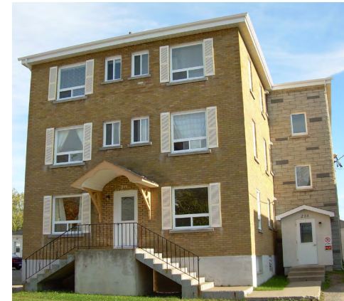
271-273, rue Saint-Robert (Saint-Robert) Société rimouskoise du patrimoine