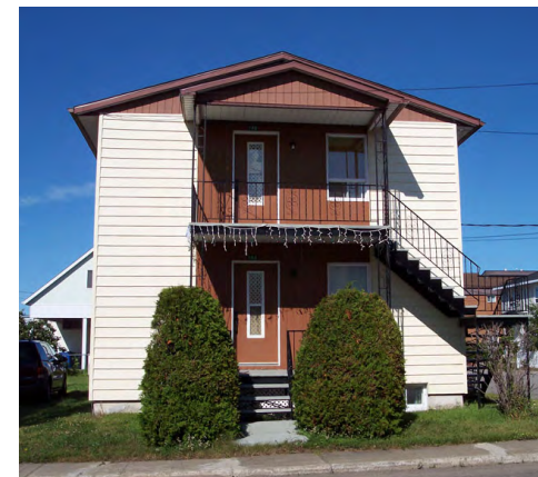
146-148, rue Fiset (Sainte-Agnès) Société rimouskoise du patrimoine