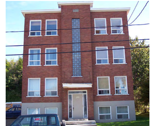
293, rue Saint-Pierre (Sainte-Agnès) Société rimouskoise du patrimoine