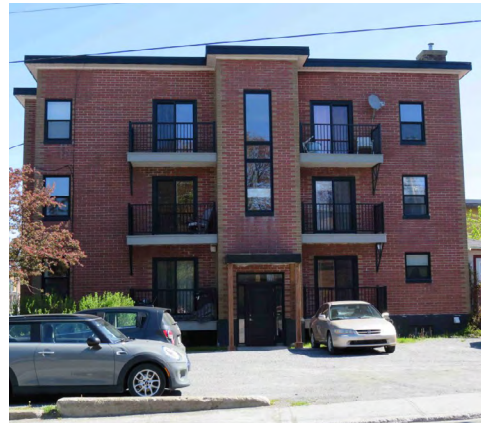
189, rue Saint-Germain Ouest (Saint-Germain) Société rimouskoise du patrimoine

Les plex prendront plusieurs formes, ils ne seront pas construits à répétition comme dans les grandes villes du Québec. Ces bâtiments auront des particularités architecturales empruntées à d'autres styles. La circulation verticale sera aussi en façade avant . Toutefois, les escaliers et les galeries se déploieront sur une plus grande surface que dans les centres urbains comme Québec ou Montréal, puisque la densité du bâti le permet ici.