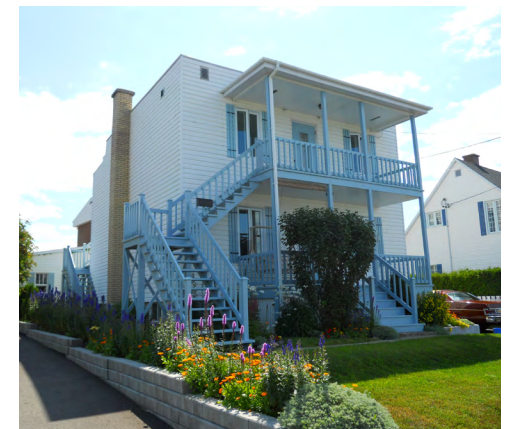
375-377, rue Saint-Germain Est (Sainte-Agnès) Société rimouskoise du patrimoine