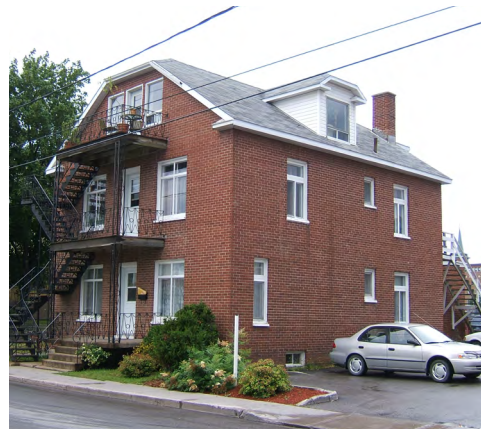
192-196, avenue Rouleau (Saint-Germain) Société rimouskoise du patrimoine