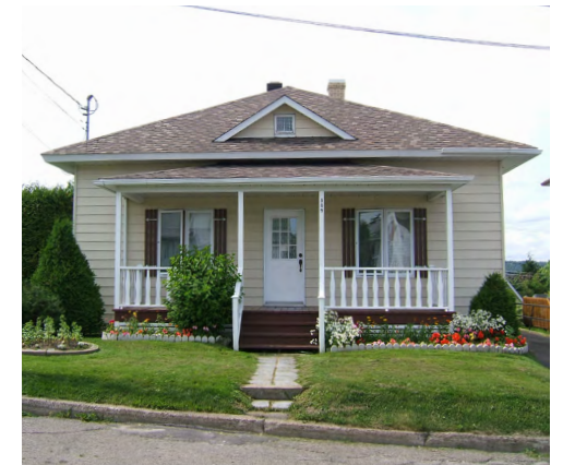
309, rue Louis-Panet (Saint-Robert) Société rimouskoise du patrimoine