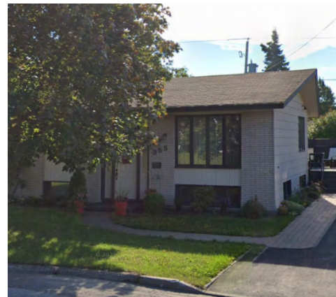
355, rue Morissette (Sainte-Agnès) Google Maps