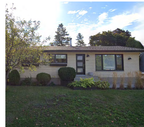
411, rue Raymond (Nazareth), 2021 Google Maps