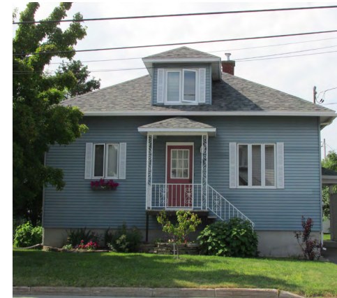
28, 4e Rue Est (Saint-Pie-X) Société rimouskoise du patrimoine