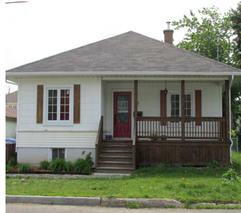
13, 3e Rue Est (Saint-Pie-X) Société rimouskoise du patrimoine

Les bungalows seront adaptés selon les goûts du propriétaire. Généralement, seulement la façade avant sera traitée de façon significative. Celle-ci imitera des styles architecturaux du Québec ou d'ailleurs. Elle sera garnie d' arcs , de fausses toitures mansardées , de jeux de revêtement mural , de jeux de couleurs, etc., en respectant une asymétrie. Il sera possible de distinguer l'usage des pièces intérieures, notamment le salon ou le séjour et d'autres pièces de plus petites dimensions comme le suggèrent les fenêtres en façade avant. Les autres façades seront toutefois lissées et sans ornementation .