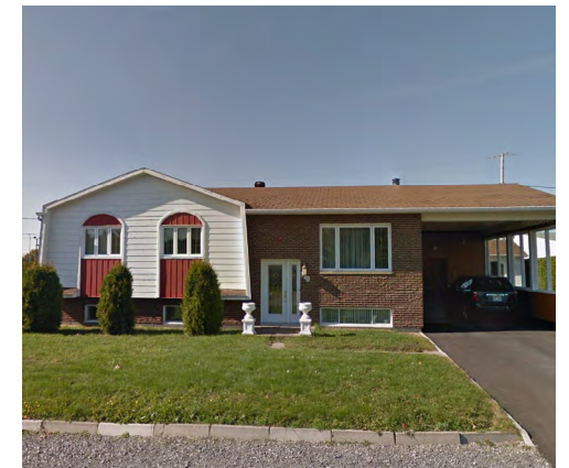
170, rue du Sieur (Pointe-au-Père), 2020 Google Maps