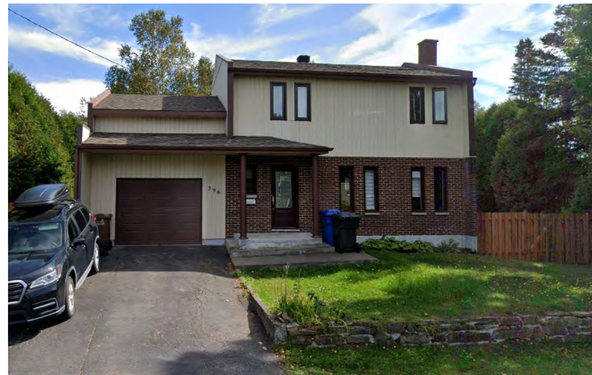
396, avenue Pierre-Rouleau (Pointe-au-Père), 2021 Google Maps

Avec la levée de l'importance de l'environnement et des changements climatiques, une attention particulière sera accordée à l'architecture durable dite « verte », qui permet de diminuer l'empreinte écologique des bâtiments. Des pratiques durables dans le domaine de la construction seront mise de l'avant. Des certifications, comme LEED élaboreront des normes et grilles d'analyse pour évaluer les constructions selon des critères de réduction d'émissions de carbone, de conservation des ressources et de réduction des frais d'exploitation [Conseil du bâtiment durable du Canada, 2023].