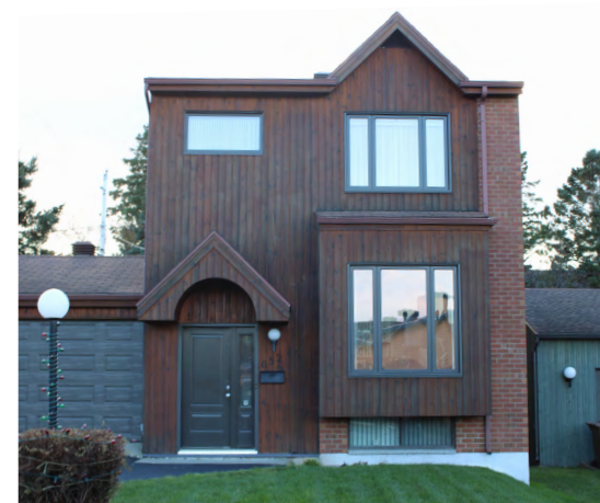
652, rue des Conifères (Sacré-Cœur), 2023