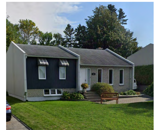
439, rue des Sarcelles (Terrasse Arthur-Buies), 2021