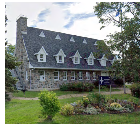
75, boulevard Arthur-Buies (Terrasse Arthur-Buies), 2021 Google Maps