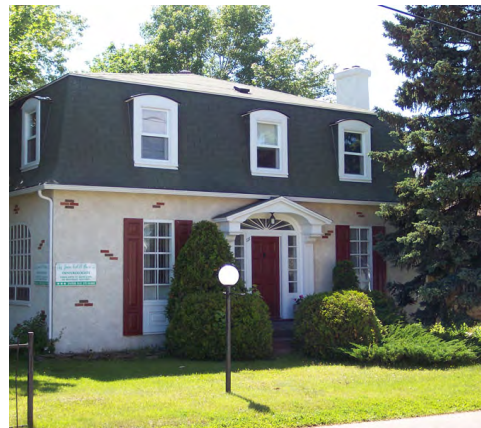
121, rue Lavoie (Saint-Germain)

Pour une meilleure compréhension de ces styles, il est favorable de se référer aux styles traditionnels imités, dont esprit français 4A.1, maison québécoise 4A.2 et maison à mansarde 4A.3.