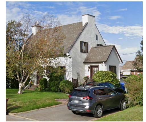
266, rue des Mélèzes (Nazareth), 2021