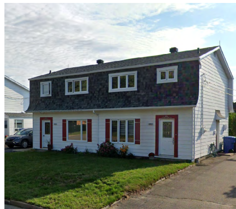
449-451, rue du Père-Rouillard (Terrasse Arthur-Buies), 2021