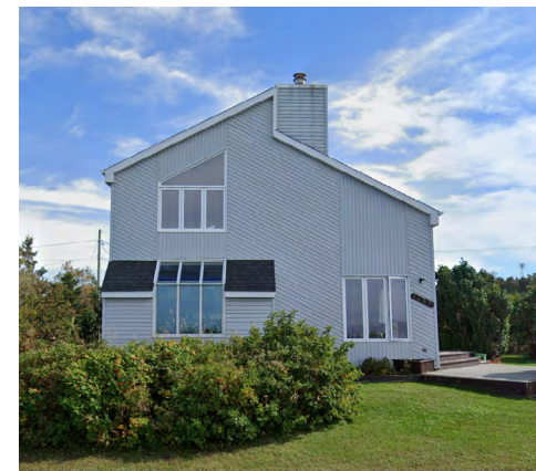
23, chemin du Sommet Est (Saint-Pie-X), 2019