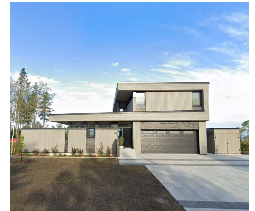
894, rue d'Youville (Sacré-Cœur), 2021