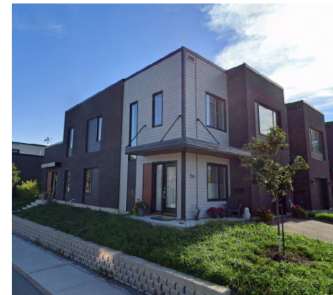
156-170, rue Jean-Brillant (Saint-Germain), 2021