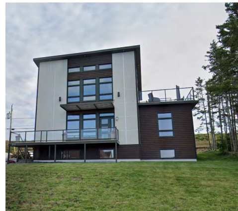
203, rue Beauregard (Terrasse Arthur-Buies), 2021 Google Maps