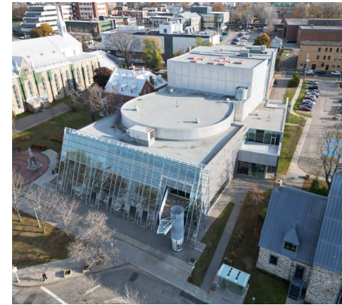
25, rue Saint-Germain Ouest (Saint-Germain), 2022