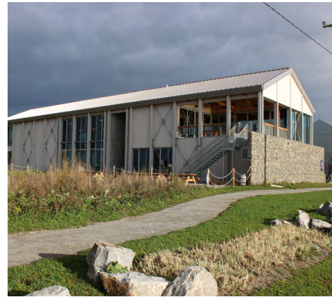
135, avenue du Père-Nouvel (Pointe-au-Père), 2023

Puisque l'architecture contemporaine représente globalement un style que l'on peut retrouver ailleurs au Québec, en Amérique du Nord et dans le monde, il est difficile de pointer des particularités de cette architecture à Rimouski. Cependant, notons le cadre maritime et les paysages côtiers qui rythment les façades des bâtiments. De grandes ouvertures sont pratiquées dans les murs pour permettre une perméabilité entre l'intérieur et l'extérieur du bâtiment. Les vues sur les milieux naturels notamment vers le fleuve Saint-Laurent sont mises de l'avant à Rimouski.