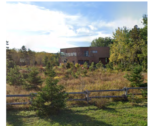
777, rue de la Plage (Sacré-Cœur), 2021 Google Maps