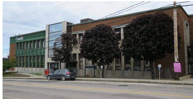
Façade du 180, avenue de la Cathédrale Société rimouskoise du patrimoine

La valeur paysagère (environnementale) repose sur sa distinction avec les autres édifices fédéraux de son époque par le lien historique qu'il entretient avec son site et avec le paysage urbain depuis sa construction. Par ses dimensions et ses matériaux, l'édifice fédéral s'intègre harmonieusement parmi les bâtiments environnants. Malgré son apparence modeste, l'édifice occupe une position stratégique le long de la côte de l'avenue de la Cathédrale, au cœur de Rimouski. De fait, il a longtemps été fréquenté assidûment par les Rimouskois en tant que bureau de poste régional. La présence d'un édifice du gouvernement fédéral contribuait au caractère institutionnel des environs.