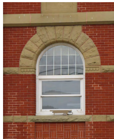
Fenêtre et arc cintré Société rimouskoise du patrimoine