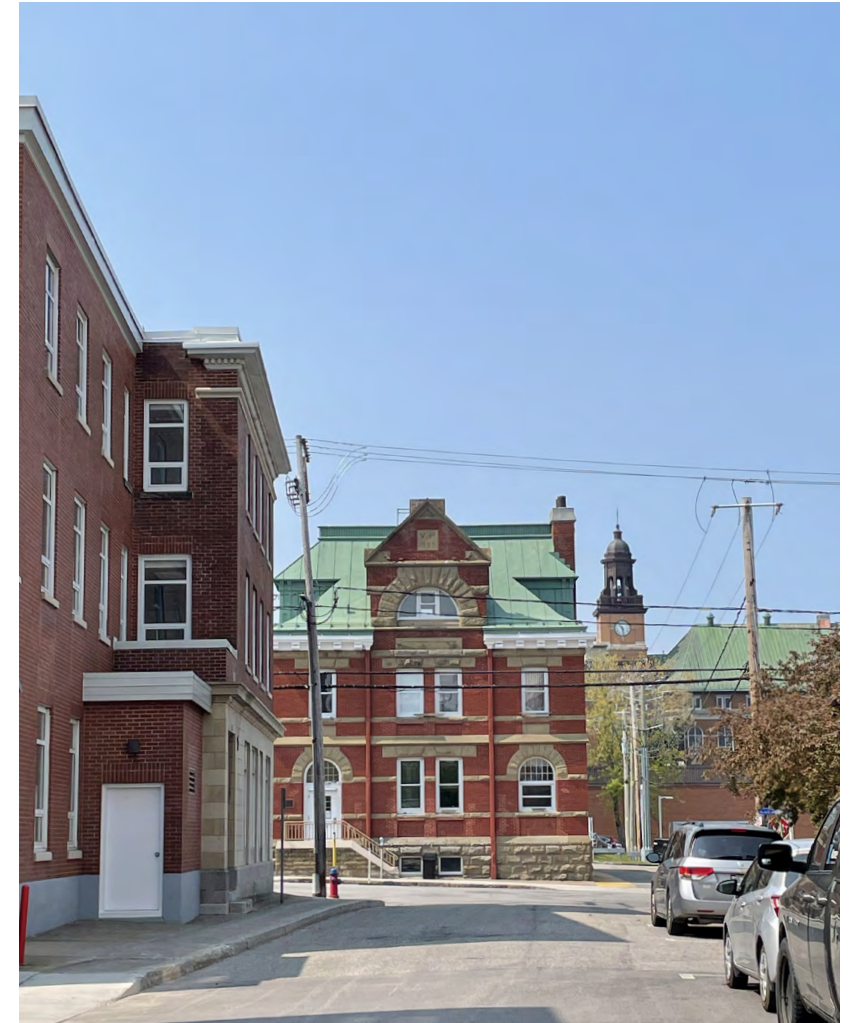
Édifice de la poste depuis la rue Jules-A.-Brillant, 2023 Olivier Beaudin, Ville de Rimouski