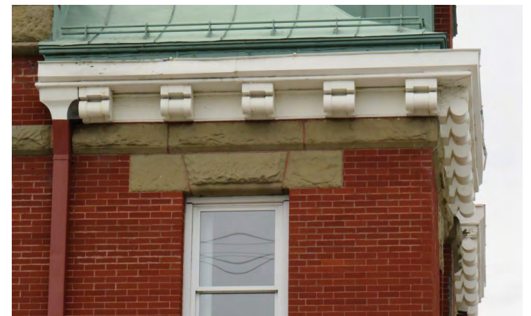
Linteau, corniche et toiture Société rimouskoise du patrimoine