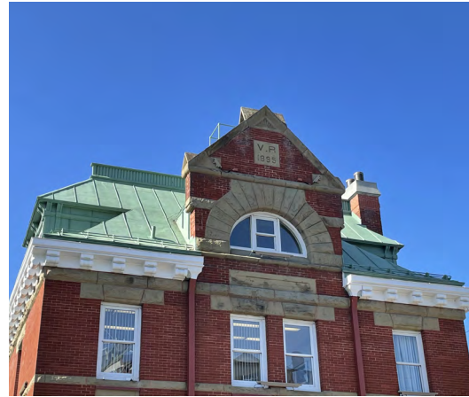
Lucarne centrale, 2023 Olivier Beaudin, Ville de Rimouski

La valeur paysagère (environnementale) repose sur sa présence au centre-ville, sur un terrain en hauteur, à l'intersection en « T » de l'avenue de la Cathédrale et la rue Jules-A.-Brillant. L'emplacement choisi lui procurait un maximum d'impact visuel sur la communauté. Il est construit aux côtés du palais de justice et son ancienne prison, de l'hôtel de ville auquel il fait désormais partie, et d'autres édifices de professions libérales le long de l'avenue de la Cathédrale. L'édifice représente une forme architecturale compatible avec son environnement bâti et un exemple typique d'édifices implantés dans les petites villes de la province à la fin du 19e siècle et le début du 20e siècle [Rapport interne numéro 83-52 du Bureau d'examen des édifices fédéraux du patrimoine, 1983].