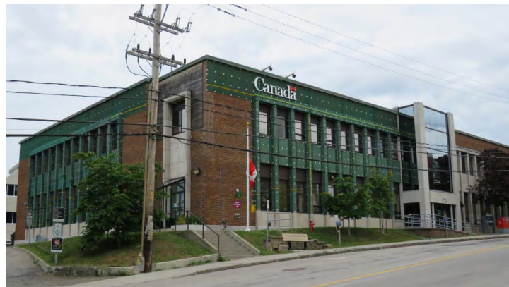
Édifice du 180, avenue de la Cathédrale Société rimouskoise du patrimoine