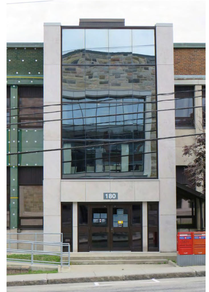
Avant-corps contemporain du 180, avenue de la Cathédrale Société rimouskoise du patrimoine