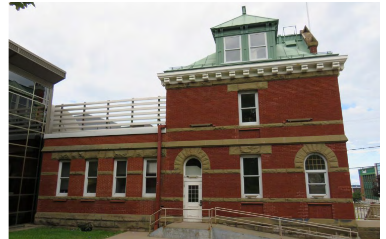
Façade gauche Société rimouskoise du patrimoine

La valeur architecturale repose sur son association avec l'architecte Thomas Fuller (1823-1898), qui eut un profond impact sur les édifices fédéraux de cette période. À l'échelle du catalogue des autres édifices dessinés par l'architecte, le bureau de poste et des douanes de Rimouski est modeste, mais richement ornementé en comparaison aux bâtiments de la ville. Il reste toutefois un vestige architectural important témoignant du rôle qu'a joué Rimouski à la fin du 19e siècle et le début du 20e siècle. L'édifice illustre les divers degrés d'ornementation des bureaux de poste du pays.