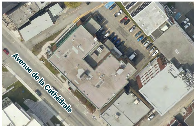
Localisation Ville de Rimouski

L'édifice fédéral situé au 180, avenue de la Cathédrale à Rimouski a été construit en 1951-1952 pour servir de bureau de poste et de bureaux gouvernementaux, selon des plans préparés par le ministère des Travaux publics alors que E. A. Gardner était architecte en chef intérimaire. Jusqu'en 2021, il servait de lieu de travail pour différents ministères fédéraux. Avant de quitter l'inventaire du gouvernement fédéral, l'édifice était un édifice du patrimoine reconnu depuis 1998 par le Bureau d'examen des édifices fédéraux du patrimoine (BEÉFP) pour ses valeurs historique et architecturale. L'édifice n'appartenant plus au gouvernement du Canada, il ne détient donc plus la désignation officielle. Ceci dit, le bâtiment reste un témoin historique, architectural et paysager important pour le centre-ville de Rimouski.