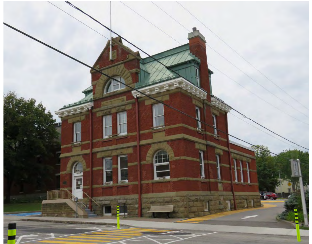
Édifice du 189, avenue de la Cathédrale Société rimouskoise du patrimoine