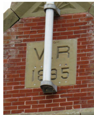
Pierre millésimée et épithaphe Société rimouskoise du patrimoine