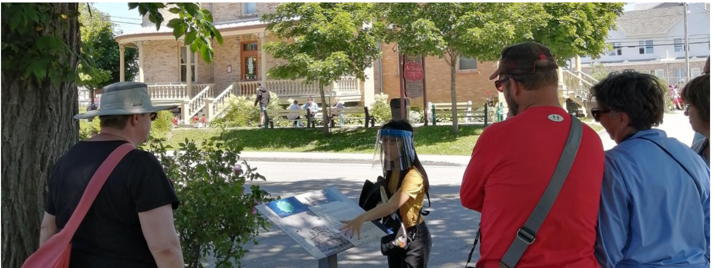
Visite guidée des Circuits Rimouski, Énya Kerhoas, 2021

Mandatée par le Service des loisirs, de la culture et de la vie communautaire de la Ville de Rimouski pour assurer l'animation patrimoniale, la Société rimouskoise du patrimoine offre une visite exclusive et gratuite du centre-ville en compagnie d'un·e guide-interprète.