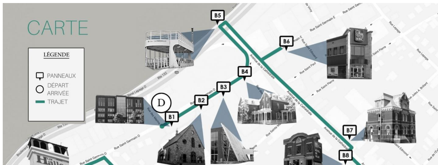
Extrait du Rallye à la découverte de Rimouski, Carte, 2021.

Ce projet est financé via l'Entente de développement culturel entre la Ville de Rimouski et le ministère de la Culture et des Communications.