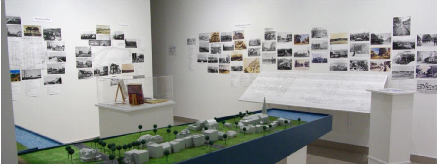
Vue partielle de l'exposition Rimouski, de la seigneurie à la ville, 325 ans d'histoire , Carl Johnson, 2021.

Deux maquettes, l'une témoignant de l'implantation de quelques bâtiments en bordure du fleuve, au pied de l'avenue de la Cathédrale vers 1898 et l'autre, illustrant la présence des immeubles sur l'avenue de la Cathédrale, du fleuve à la rue de l'Évêché, vers 1946, permettaient aux visiteurs de mieux comprendre la composition de la partie basse de cette importante artère de la ville. Les photographies illustrant l'histoire de Rimouski par son ancien urbanisme et son patrimoine bâti, dont quelques exemples sont encore visibles de nos jours, permettaient aux visiteurs de découvrir le Rimouski des années 1870-1930 et de comprendre la transformation du paysage urbain.