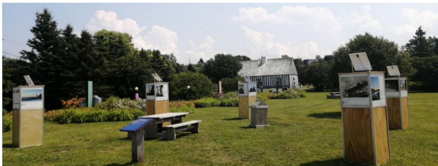
Exposition Cubes de patrimoine , Énya Kerhoas, édition 2021.