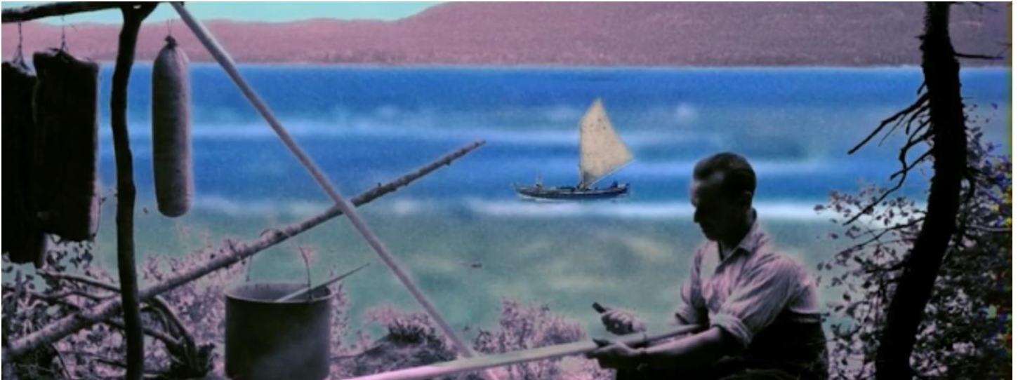
Extrait du conte La boîte des Lepage , Paralœil, 2021.