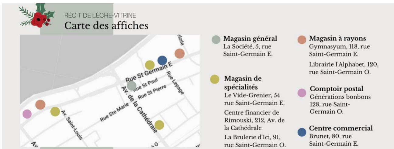
Carte du circuit éphémère Récit de lèche-vitrine , édition 2021.

Circuit éphémère du temps des fêtes 10 décembre 2021 au 6 janvier 2022