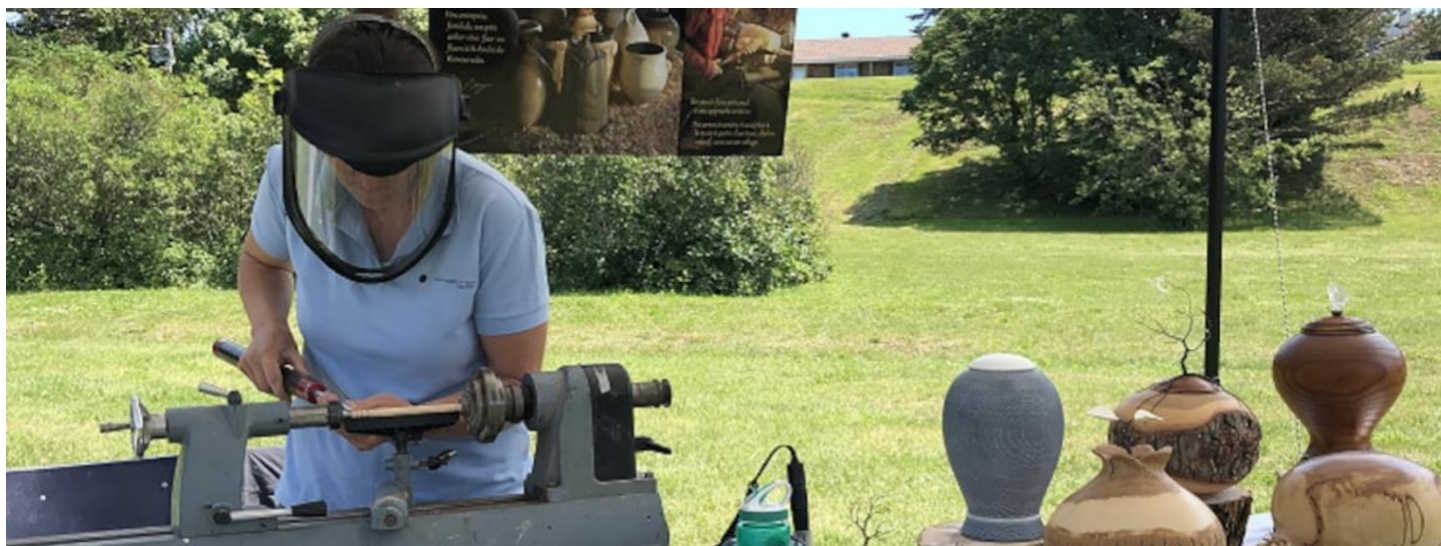
Marché des artisans, Radio-Canada, juillet 2021.

À la manière d'un circuit découverte, divers savoir-faire traditionnels étaient mis en valeur sur le Site historique de la maison Lamontagne. Cinq artisanes professionnelles (maroquinière, céramiste, ébéniste, verrière et vannière), membres de Métiers d'arts Bas-Saint-Laurent, ont fait des démonstrations de leurs techniques.