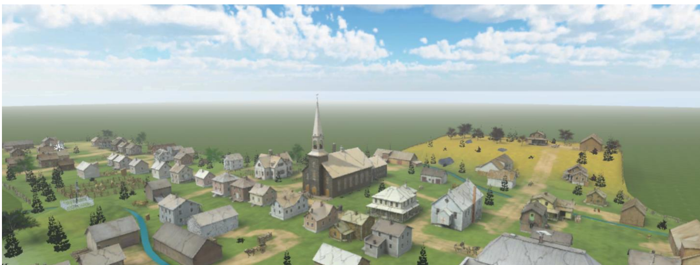
Maquette virtuelle, Village de Sainte-Blandine en 1925, IDHP, 2019-2021

Le deuxième volet du projet consiste à réaliser, à partir de l'environnement numérique 3D de cette maquette, un jeu d'immersion à vocation éducative (de type « jeu sérieux »). Le jeu SOUVENANCE / Visite au pays des habitants de l'estuaire du Saint-Laurent , qui aura principalement comme public cible les étudiant-es du secondaire, a pour but de s'arrimer au programme d'univers social (histoire et géographie) en faisant découvrir, par l'immersion 3D, l'histoire et la géographie de la région de Rimouski/Sainte-Blandine (et plus largement de l'estuaire). Il s'agira d'un jeu de quête dans lequel le joueur se promènera à la fois dans l'espace et dans le temps : le scénario (en développement) mettra en scène les environnements naturels et bâtis ainsi que la culture matérielle des différents groupes culturels qui ont occupé le territoire (Premières Nations, pêcheurs basques, colonisateurs français et habitants eurocanadiens), depuis le 14 e siècle jusqu'en 1925.