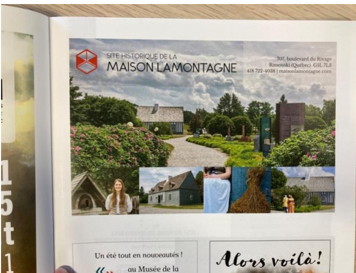
Extrait du magazine Cap-Aux-Diamants, Rimouski, bien plus que 325 ans d'histoire , été 2021.