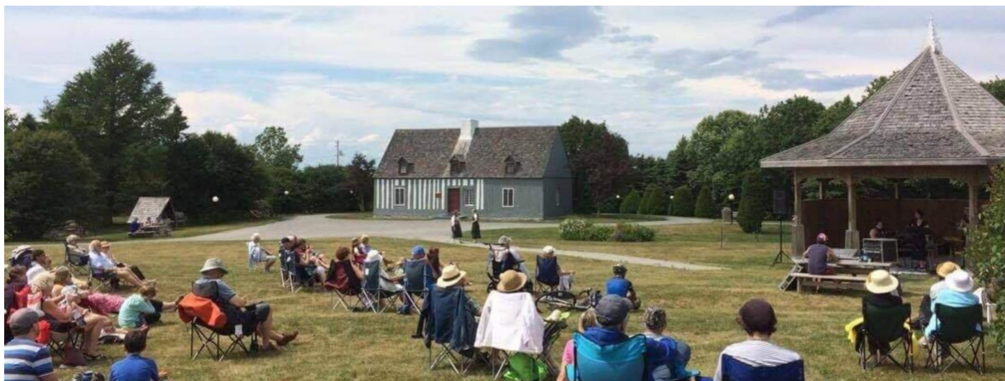
Spectacle musical lors des Dimanches en musique